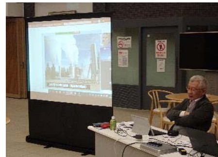
【地熱オンライン講座の様子（2020年）】

※参考 これまでのゆざわ学講座受講者延べ人数 { ( ) 内はガイド養成講座受講資格者数 }