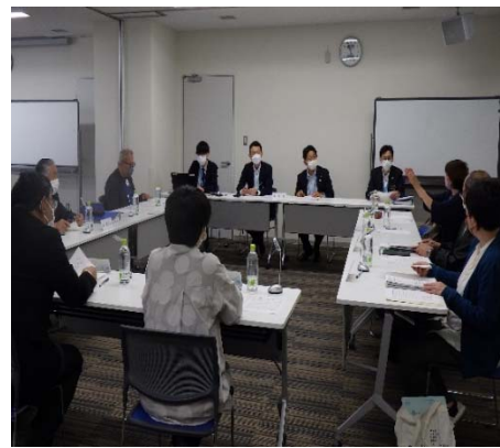
【5月16日に行われた評価市民会議（公開プレゼンテーション）】