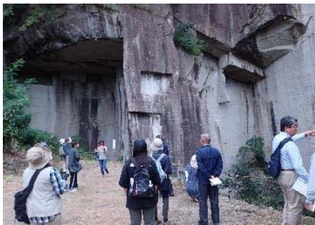
【院内石に触れる現地学習の様子（2019年）】

8回以上の受講者には修了証を交付するほか、来年度の「ゆざわジオパークガイド養成講座」の受講資格が得られます。