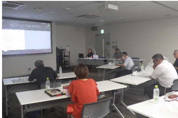
【公開プレゼンテーションの様子】

9月5日に開催した第2回公開プレゼンテーションでは、下記の提案事業を審査し、2件とも採択されました。