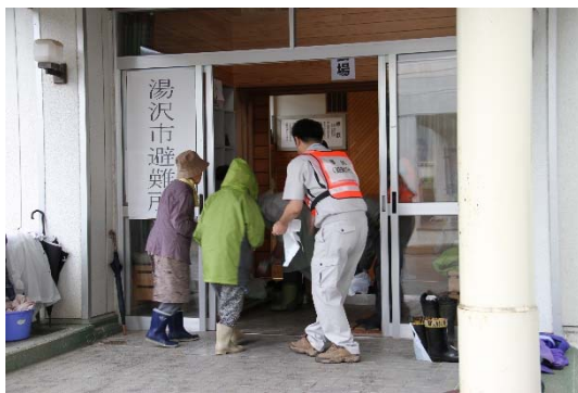
【自主防災活動訓練】

当日は、午前9時に最大震度7を観測する地震が発生したという想定のもと、市内全域を対象としたシェイクアウト訓練を皮切りに、湯沢地域の各会場で下記のとおり各種訓練が行われます。