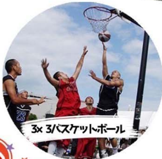
3x3バスケットボール