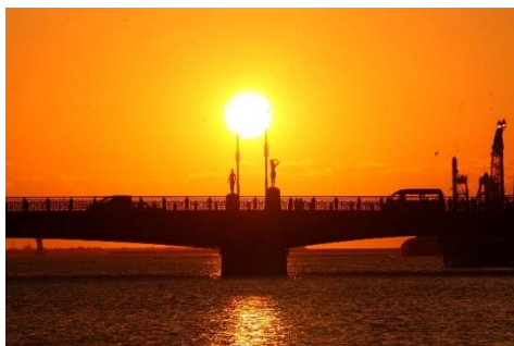
【幣舞橋から望む夕日】