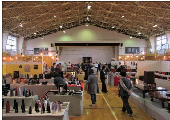
【前回のフェアの様子】

期間中は、沈金・蒔絵の実演のほか、稲川地域の特産品や各商店の選りすぐりの川連漆器が当たるお買い物スタンプラリーを行います。また、本場稲庭うどんを川連漆器のうどん椀で味わえる「稲庭うどん茶屋」も開設します。