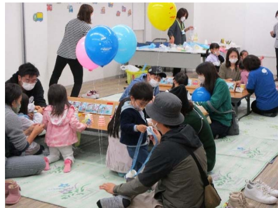
【昨年度のイベントの様子】