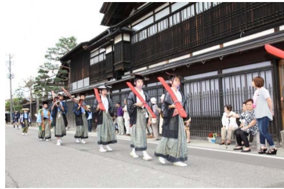
【これまでに行われた大名行列の様子】