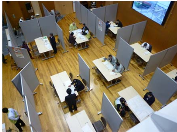
【相談会場（イメージ）】