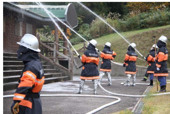
【建物火災防ぎょ訓練】