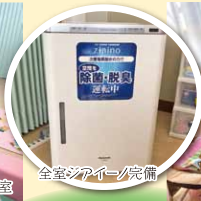
全室ジアイノ完備