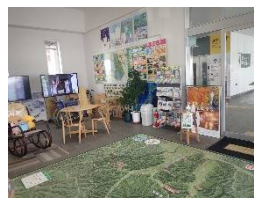
【ゆざわジオパークの魅力を 紹介するコーナー】