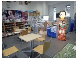
【観光案内施設内の様子】