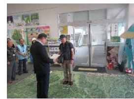
【20万人達成セレモニー】