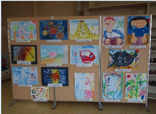
弁天地区センターに展示された児童の作品

委員のほかに全職員が参加して熟議を行いました。熟議では複数の提案がありました。その一つである「公民館等での作品展示を行うこと」を實現できて、学校と地域のつながりを深める一助になりました。