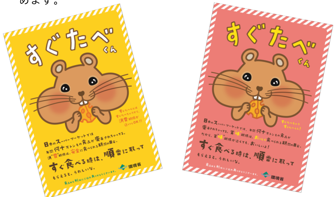
▲環境省消費行動啓発キャラクター“すぐたベくん”

イ：買物時に「買いすぎない」、料理を作る際「作りすぎない」、外食時に「注文しすぎない」、そして「食べきる」ように努めます。