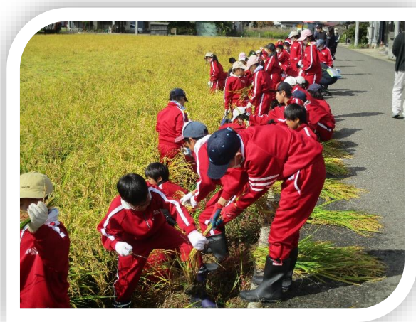
▲小学生による稲刈り作業

イ：生産者と消費者が交流する機会の一環として、都市・農村の交流を行い、生活における食の重要性について理解を深めます。