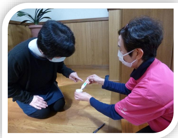
▲家庭訪問でのみそ汁の塩分測定