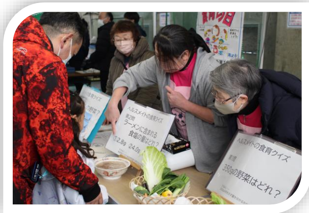
▲食生活改善推進員の活動状況