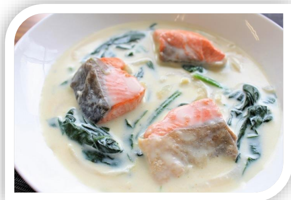
▲減塩レシピ鯉のクリーム煮