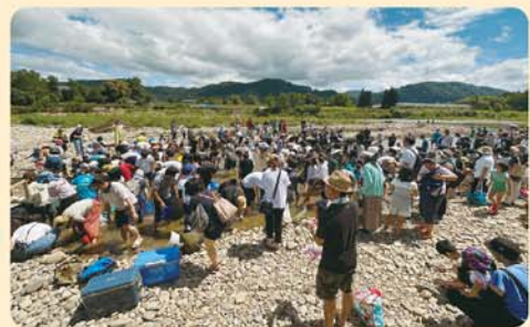
チビっ子アユつかみ大会