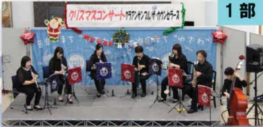
NG吹奏楽団クラリネットアンサンブル