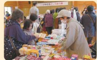
いわさきごっこお市