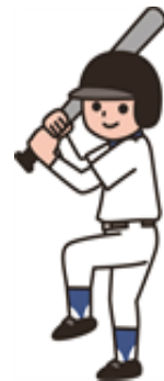
【リニューアルした稲川野球場】