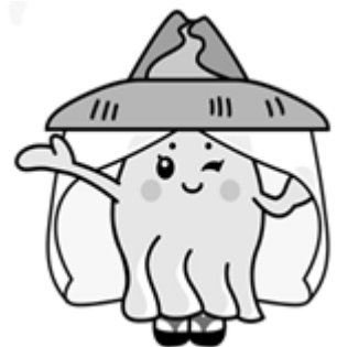
ゆざわジオパークキャラクター 「しず小町」