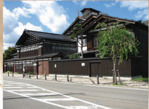
② 両関酒造 第二工場